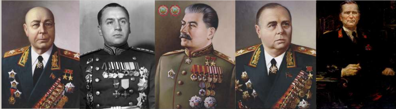
Маршал С. К. Тимошенко