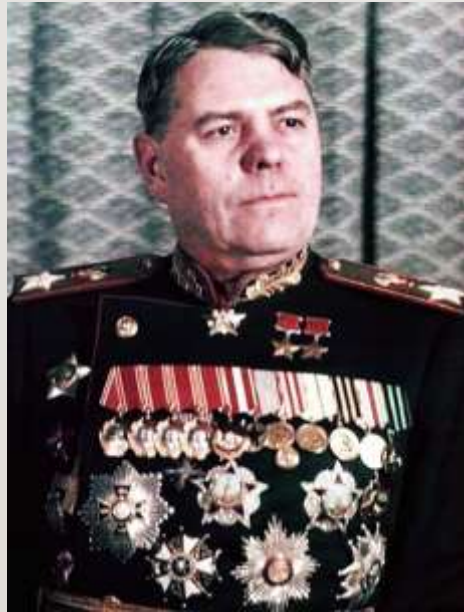
Маршал Советского Союза Александр Михайлович Василевский