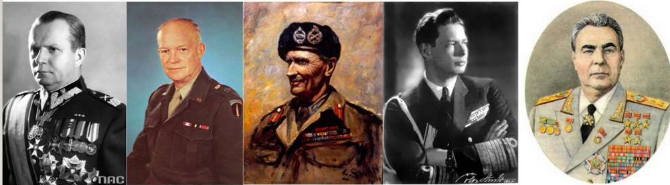
Маршал Михал Роля-Жимерский