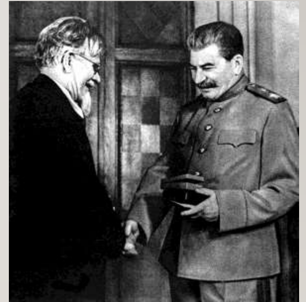
М. И. Калинин вручает Орден «Победа» Верховному Главнокомандующему Советского Союза И. В. Сталину