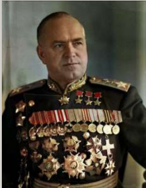
Маршал Советского Союза Георгий Константинович Жуков